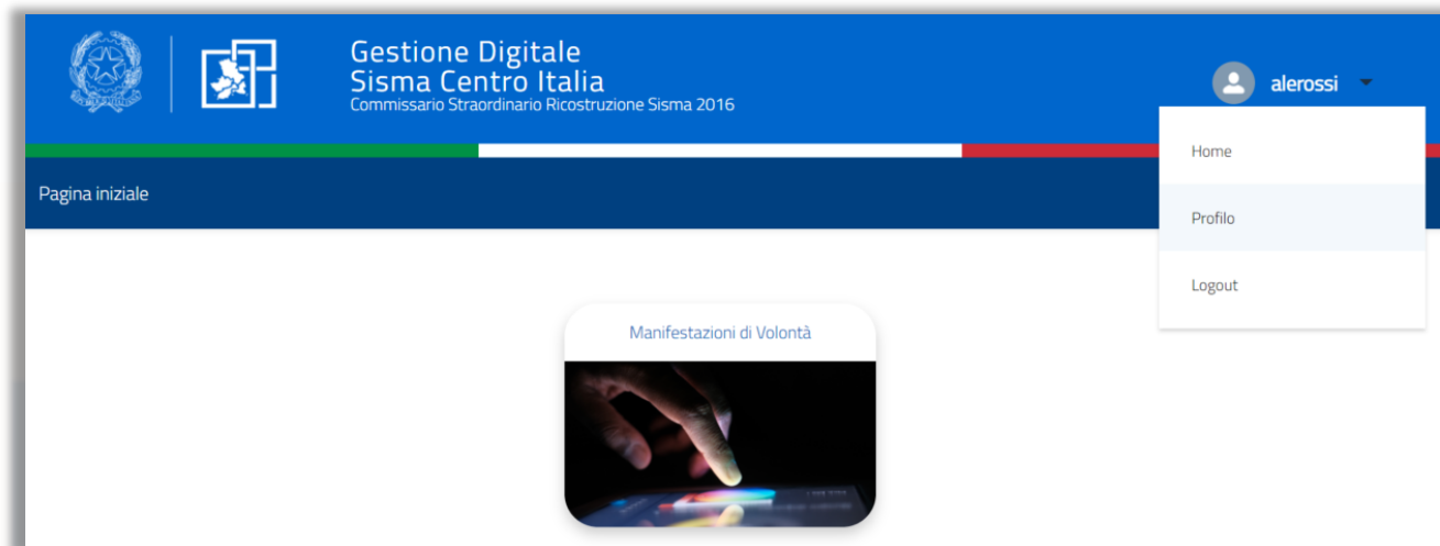
Figura 1 - Profilo personale

Dopo aver effettuato l'accesso tramite SPID, è possibile visualizzare le proprie informazioni personali cliccando sul nome utente in alto a destra e scegliendo la voce "Profilo" dal menu a tendina.