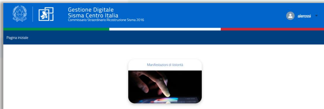
Figura 3 - Box “Manifestazioni di Volontà”

Per visualizzare le “Manifestazioni” inserite dal soggetto richiedente è possibile cliccare sul box “Manifestazioni di Volontà” che compare nella homepage.